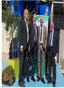
Al via Agrilevante 2019