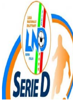
Serie D: il Fasano è primo, il Foggia bloccat...