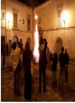
In Puglia il più grande contro-halloween d'It...