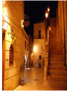
Agguato a Vieste, un uomo gambizzato. M5S: 'E...