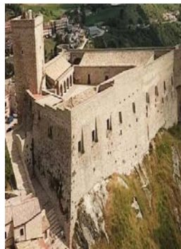
Deliceto, il Castello rivive grazie a figuran...