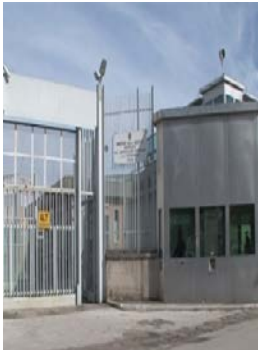
Carcere di Foggia: 'Situazione di estrema per...